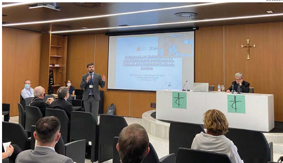
↑ Un momento de las jornadas de trabajo sobre sostenimiento de la Iglesia, la pasada semana en la CEE.

—No sabemos con certeza cuál va a ser el rol de la tecnología en nuestra sociedad a largo plazo. Hay proyectos para trasladar la parte de la conciencia del hombre a las máquinas. Esto supondría un salto exponencial tan grande que ya no seríamos capaces de seguir la evolución y nos tendríamos que fiar de las máquinas. Otro rasgo evolutivo puede abocarnos a perder la centralidad humana y convertirnos en un mero elemento más a disposición de los robots. Por eso es primordial que en toda esta evolución tecnológica no perdamos el control y que las decisiones radiquen en nosotros. En la medida en la que contamos con máquinas cada más sofisticadas, tenemos que ser más rigurosos con los límites de la inteligencia artificial. Esto ya ha pasado con la energía nuclear. La sociedad sabe que es peligrosa y estamos muy concienciados. ●